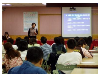
生涯發展知能研習